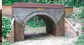
Boven/beneden: Twee van de drie smalspoortunnels bij Egypte