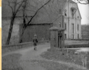
Watermolen aan d'n Bas