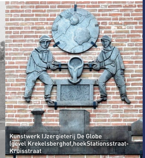
Kunstwerk IJzergieterij De Globe (gevel Krekelsberghof, hoek Stationsstraat-Kruisstraat)