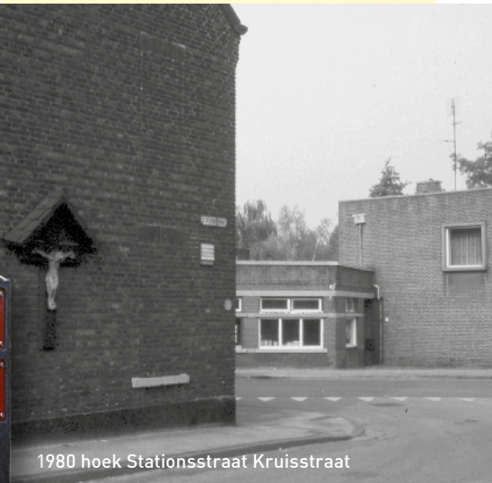
1980 hoek Stationsstraat Kruisstraat