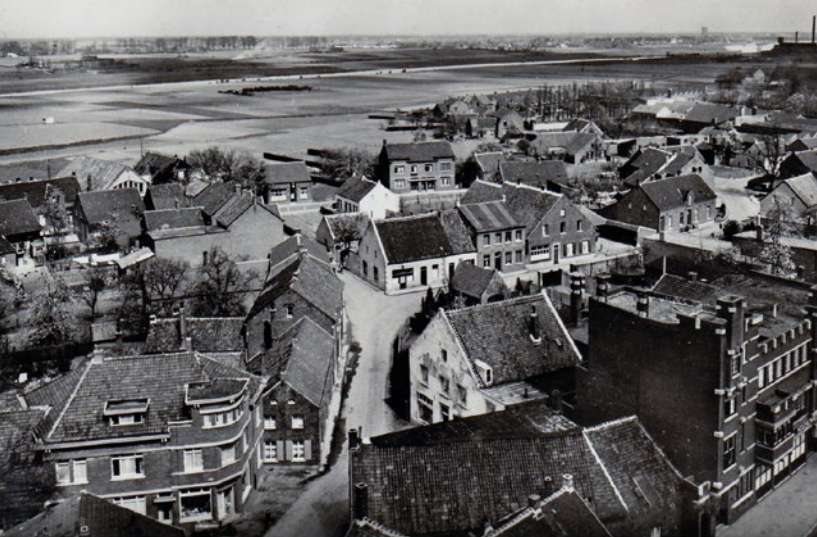
Hoekstraat- Sint Martinusstraat