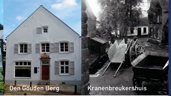
Den Gouden Berg