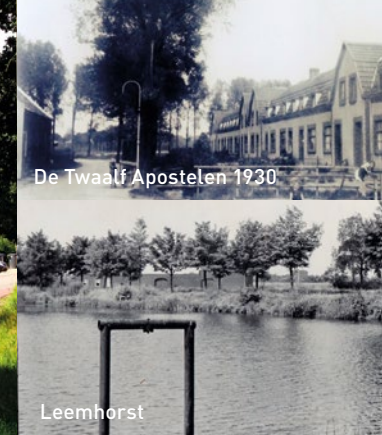
De Twaalf Apostelen 1930