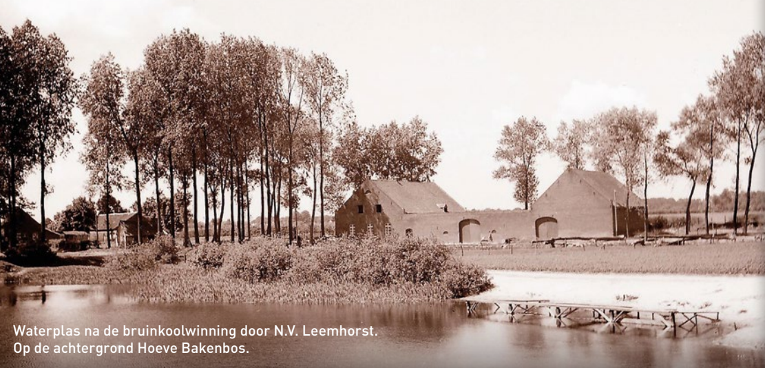
Waterplas na de bruinkoolwinning door N.V. Leemhorst. Op de achtergrond Hoeve Bakenbos.