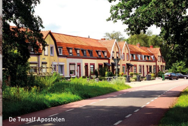
De Twaalf Apostelen