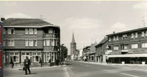
Hotel Het Wapen van Tegelen (afgebrand 1975)

In Richtung der Martinskirche liegt in der Grotestraat 84 das Vredeshuis. Im Jahr 1766 war an der Ecke Grotestraat/Posthuisstraat eine Poststation mit Pferdewechselstation gebaut worden. An der Stelle des Stallgebäudes entstand 1881 ein vornehmes Wohnhaus. Der Eigentümer gab ihm den Namen 'Huis de Vrede' (Haus Frieden). Zu Beginn des 20. Jahrhunderts hatte das Gebäude mehrere Funktionen. Von 1955 bis 1967 nutzte es die Stichting Passiespelen Tegelen als Sekretariat. Danach wurde es nach längerem Leerstand anfang dieses Jahrhunderts restauriert.